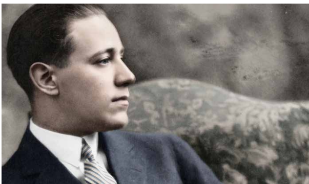
Ödön von Horváth, 1919

Im Trainingslager zur „Erziehung zum Volksgenossen“ eskaliert die Situation bis ein Leben ausgelöscht wird. Nun ist jeder gezwungen, Stellung zu beziehen: zur Wahrheit, zu sich selbst und zu Gott.