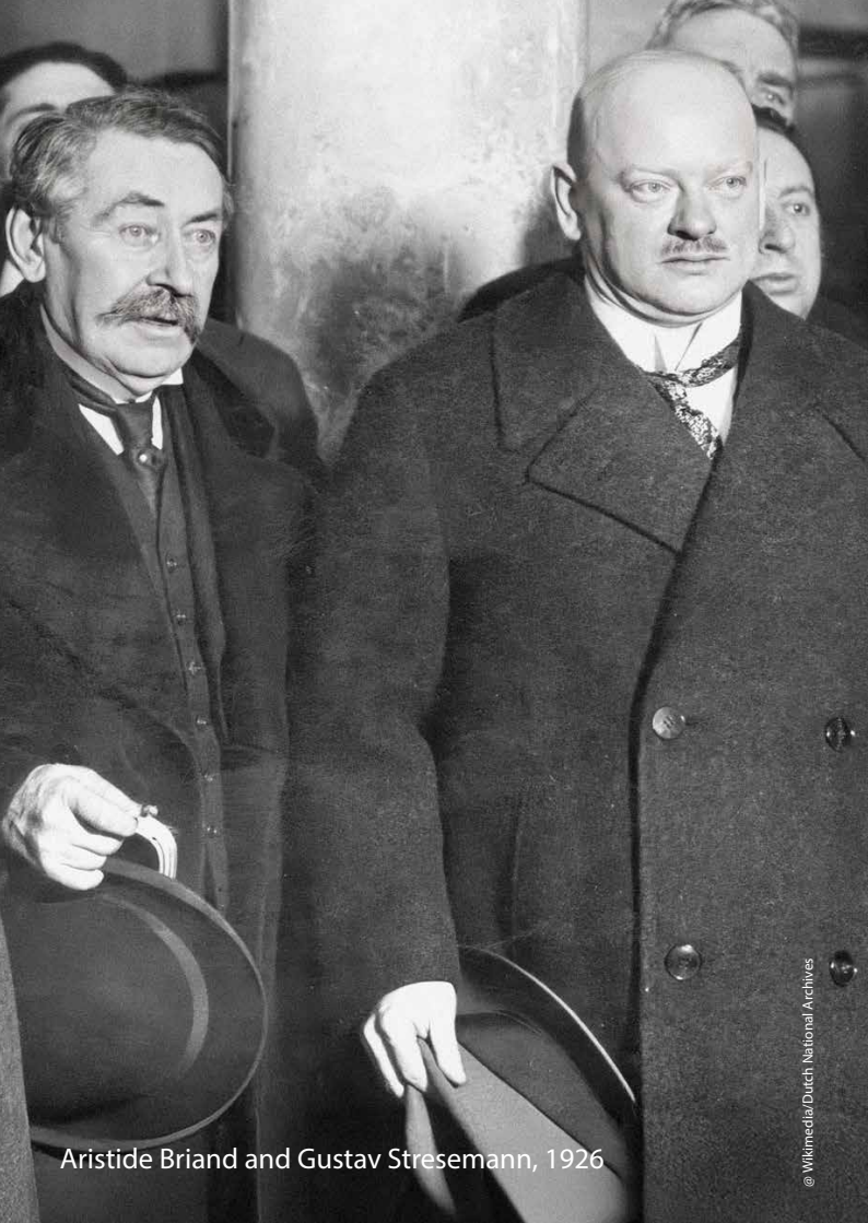
Aristide Briand and Gustav Stresemann, 1926