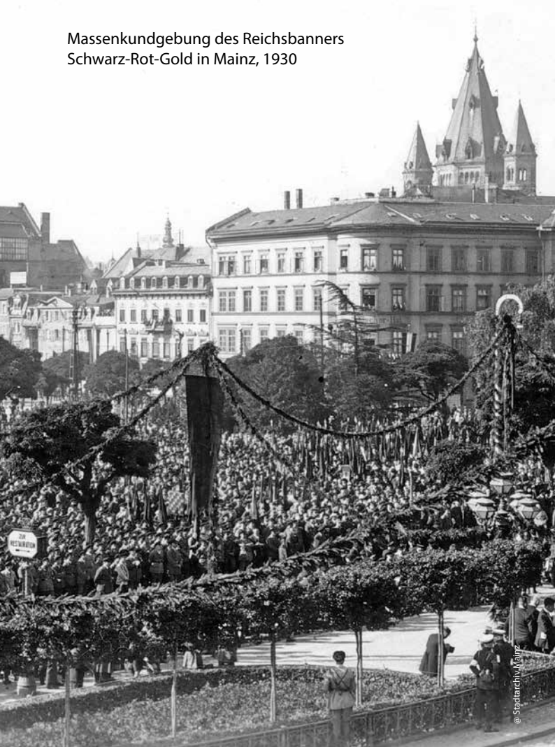
Massenkundgebung des Reichsbanners Schwarz-Rot-Gold in Mainz, 1930

übernahme“ durch Adolf Hitler und die Nationalsozialisten mündete und das „demokratische Experiment“ von Weimar nach 14 Jahren beendete.